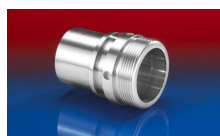
CONNECT THREAD FITTING 234