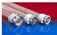
CONNECT SAFETY CLAMP ASSEMBLY 231

La sovrappressione e la sottopressione sono valori limite di funzionamento raccomandati, i prodotti possono essere sottoposti a carichi maggiori su richiesta. Il raggio di curvatura è misurato attraverso l'interno dell'arco del tubo. Ci riserviamo il diritto di apportare modifiche tecniche. Tutti i valori sono determinati a 20°C e sono dati approssimativi. Ulteriori informazioni su norres.com/it/tecnologia/ .