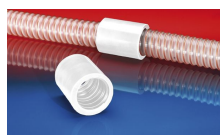
CONNECT 246 FOOD