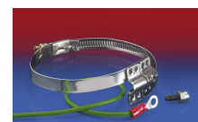
CLAMP 212 EC