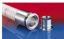
CONNECT PRESS ASSEMBLY 232