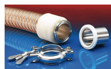
CONNECT TRI-CLAMP FITTING 245