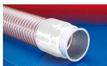
CONNECT 243 FOOD