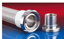
CONNECT MOULD ASSEMBLY 233