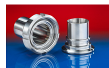
CONNECT ASEPTIC FITTING 249