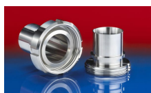
CONNECT DAIRY FITTING 247