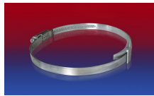
CLAMP 210 BRIDGE CLAMP